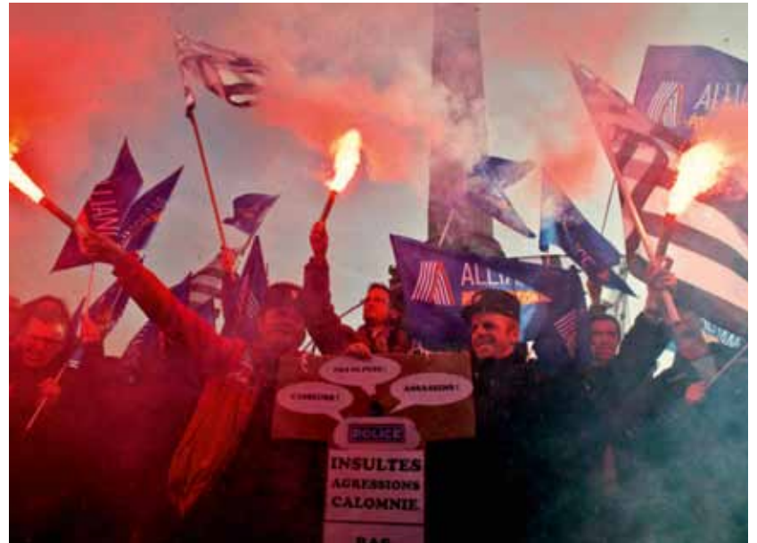
Zece mii de polițiști au denunțat, la Paris, condițiile grele de lucru, cu trei săptămâni înainte de alegerile pentru conducerea poliției.

În aceste condiții, procesele pe care le aveam pe rolul instanțelor pentru polițiștii locali din Cluj-Napoca și Târgu Jiu, au rămas fără obiect.