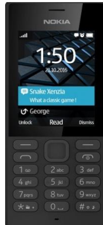
NOKIA 150 (sau similar)