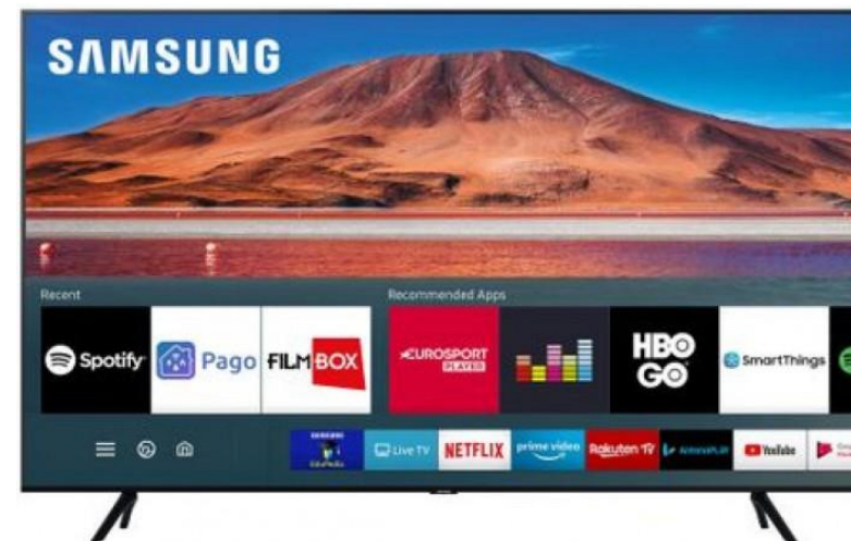
Smart TV SAMSUNG 138 cm UE55TU7172UXXH