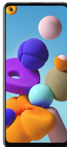
SAMSUNG GALAXY A21s