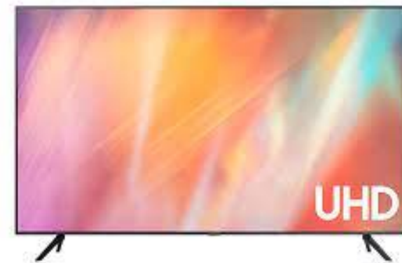
SMART TV Samsung UE43AU7172UXXH 109 cm