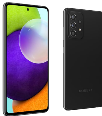
SAMSUNG Galaxy A52 4G DS 6/128GB Blk